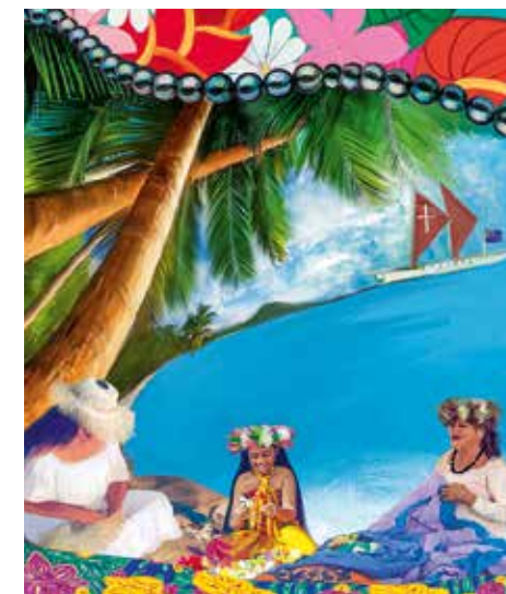
© 2023 World Day of Prayer International Committee, Inc.

Verantwortlich für die Gottesdienstordnung sind für 2025 christliche Frauen von den Cookinseln, einer Inselgruppe im Südpazifik. Die Christinnen der kleinen und weit verstreut liegenden Inseln stellen den Psalm 139 ins Zentrum ihres Gottesdienstes. Sie laden ein, die Wunder der Schöpfung zu sehen und die Freude darüber zu teilen. Trotz der auch problematischen Missionierungserfahrungen wird der christliche Glaube von gut 90% der Menschen selbstverständlich gelebt und ist fest in ihre Tradition eingebunden. Die Schreiberinnen verbinden ihre Maorikultur, ihre besondere Sicht auf das Meer und die Schöpfung mit den Aussagen des Psalm 139. Wunderbar geschaffen sind diese weit verstreut im Südpazifik liegenden Inseln, die den Inselstaat der Cookinseln bilden. Der Tourismus ist der